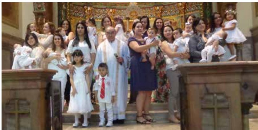
Batizado realizado por Frei Ramón Aliende Torrecilla, OAR, no dia 23 de setembro de 2018.

As inscrições para o Batismo são às terças e quintas-feiras, das 8h30 às 11 horas, e das 14 às 16h30. Não fazemos inscrições por telefone, nem no dia da preparação. Na inscrição, trazer a) cópia da certidão de nascimento da criança; b) cópia do documento de identidade dos padrinhos; e c) cópia do comprovante de residência dos pais. A documentação não será devolvida. Para a preparação: trazer cópia do documento de identidade de quem for participar.