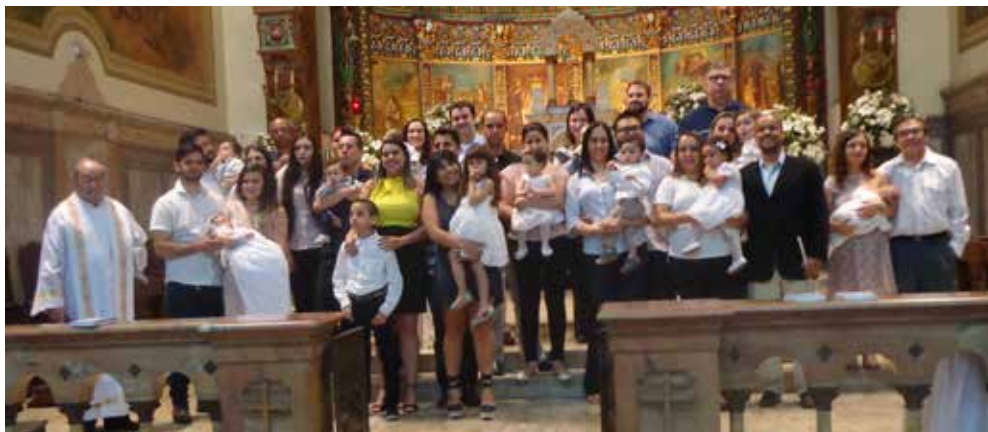
Batizado realizado por Frei Ramón Aliende Torrecilla, OAR, no dia 29 de julho de 2018.

As inscrições para o Batismo são às terças e quintas-feiras, das 8h30 às 11 horas, e das 14 às 16h30. Não fazemos inscrições por telefone, nem no dia da preparação. Na inscrição, trazer a) cópia da certidão de nascimento da criança; b) cópia do documento de identidade dos padrinhos; e c) cópia do comprovante de residência dos pais. A documentação não será devolvida. Para a preparação: trazer cópia do documento de identidade de quem for participar.